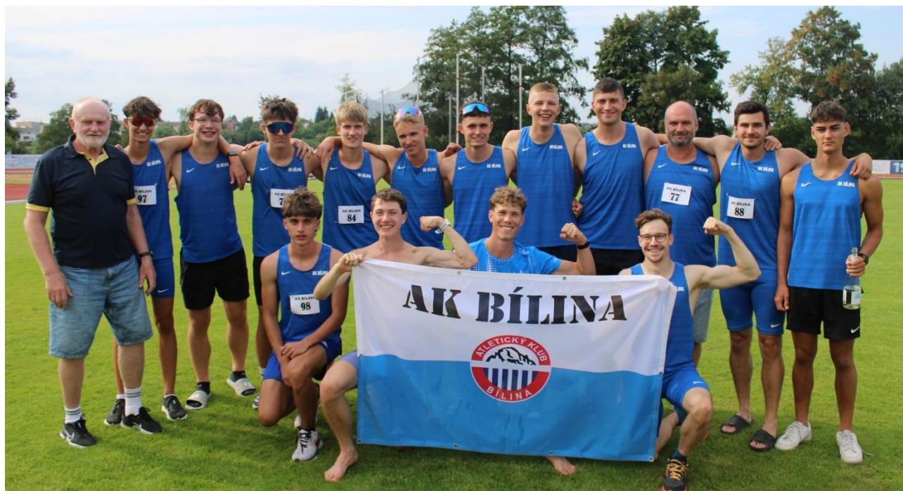
Muži 2. liga