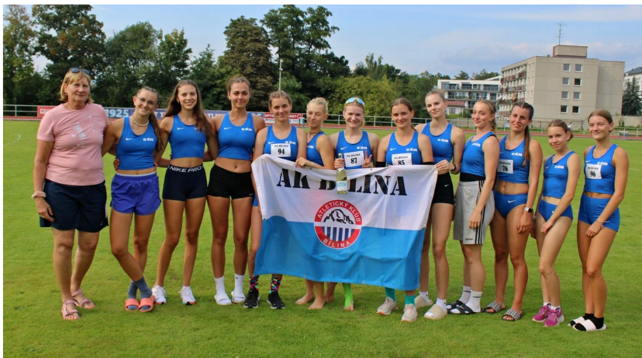
Ženy 2. liga